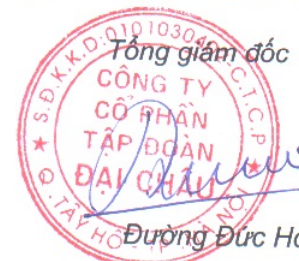
Đường Đức Hóa